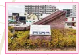
● 豊田佐吉ゆかりの赤レンガモニュメント

トヨタ産業技術記念館 トヨタグループ発祥の地。織機と自動車の産業と技術が学べる。大正時代の赤レンガ造りの工場の姿を残す記念館。